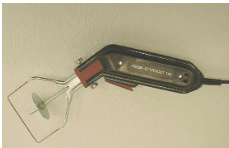
Nóż termiczny STYRO-CUT 140 z ostrzem D68-61